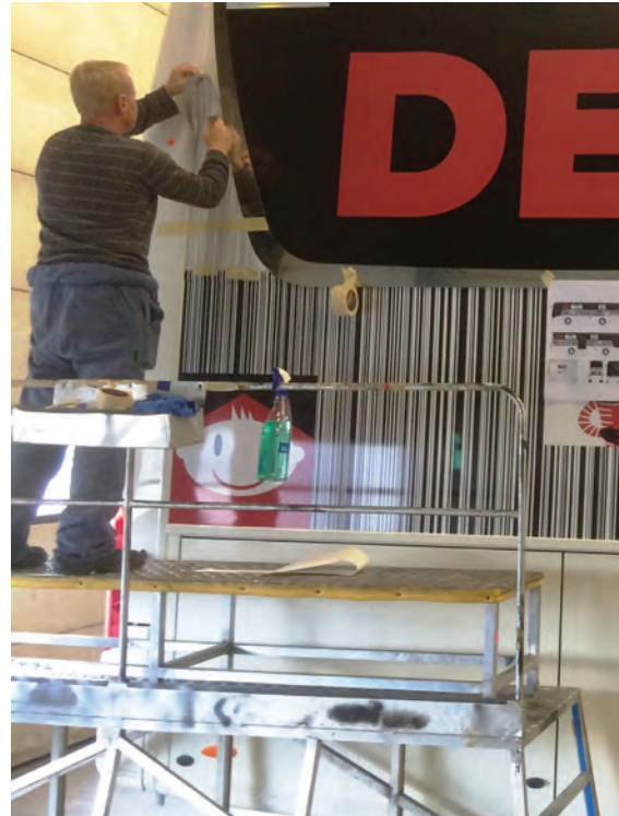
Ontwerp wordt aangebracht