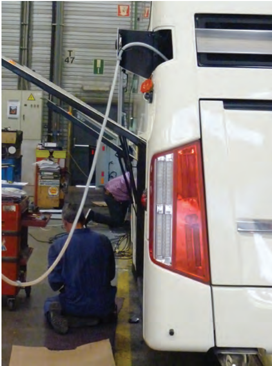
Techniker aan het werk

De leerlingen van het laatste jaar van de afdeling hout in het Sint-Lambertusinstituut werkten mee aan de inrichting en de afwerking van de Bus.